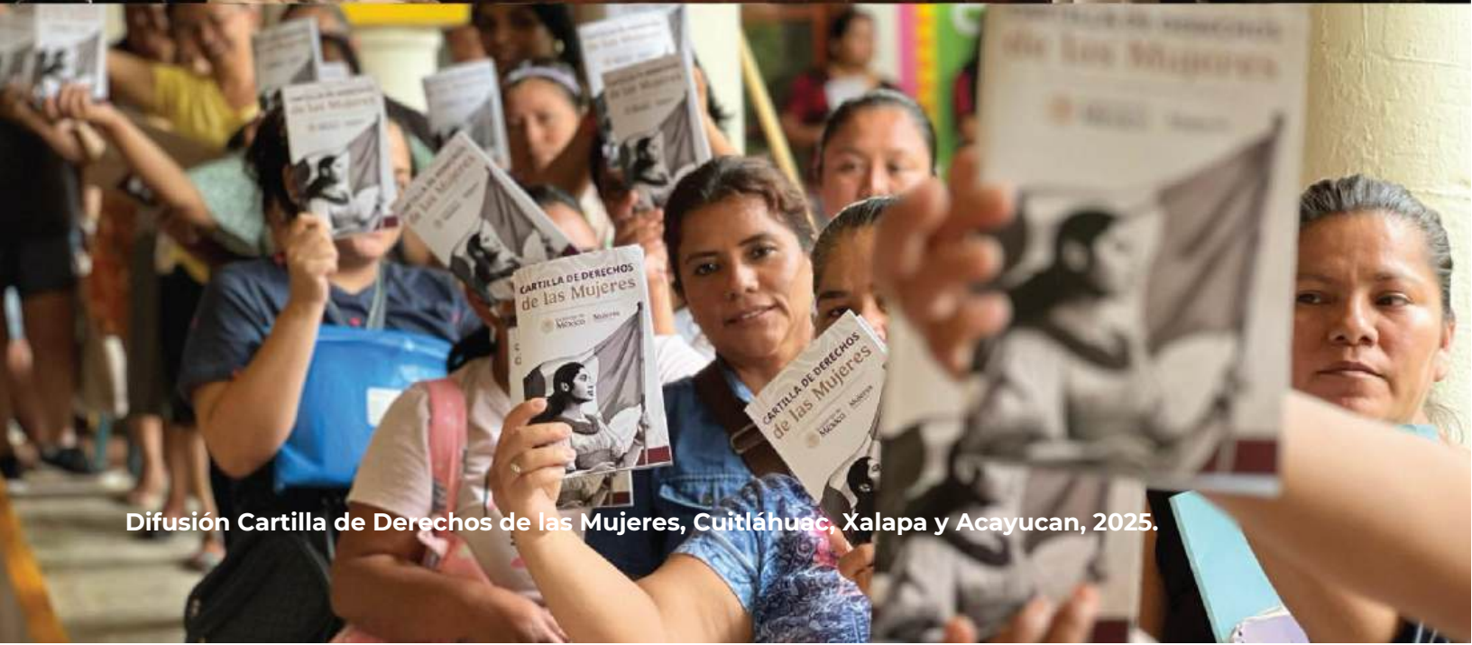
Difusión Cartilla de Derechos de las Mujeres, Cuitláhuac, Xalapa y Acayucan, 2025.