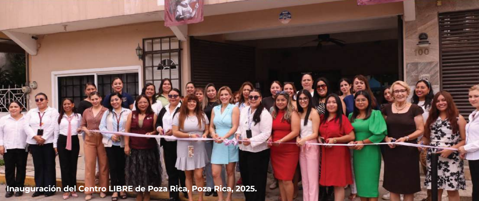
Inauguración del Centro LIBRE de Poza Rica, Poza Rica, 2025.