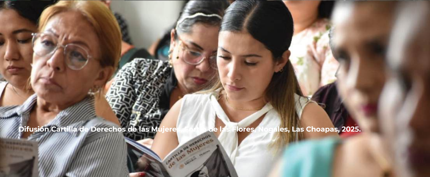
Difusión Cartilla de Derechos de las Mujeres. Feria de las Flores, Nogales, Las Choapas, 2025.