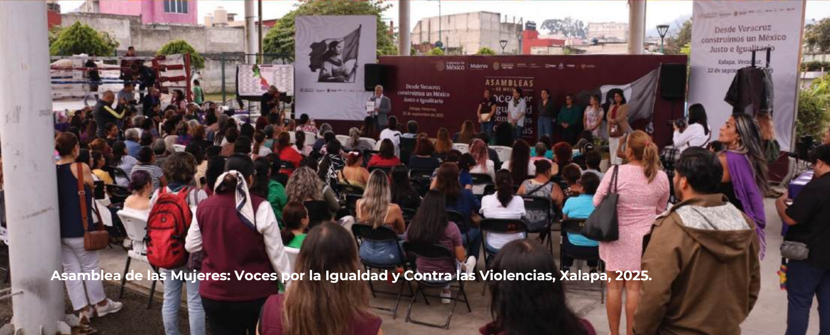
Asamblea de las Mujeres: Voces por la Igualdad y Contra las Violencias, Xalapa, 2025.