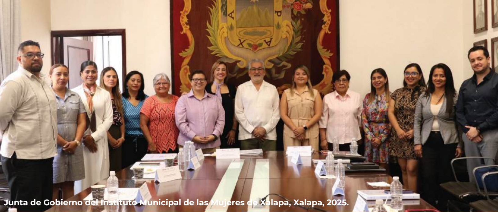
Junta de Gobierno del Instituto Municipal de las Mujeres de Xalapa, Xalapa, 2025.