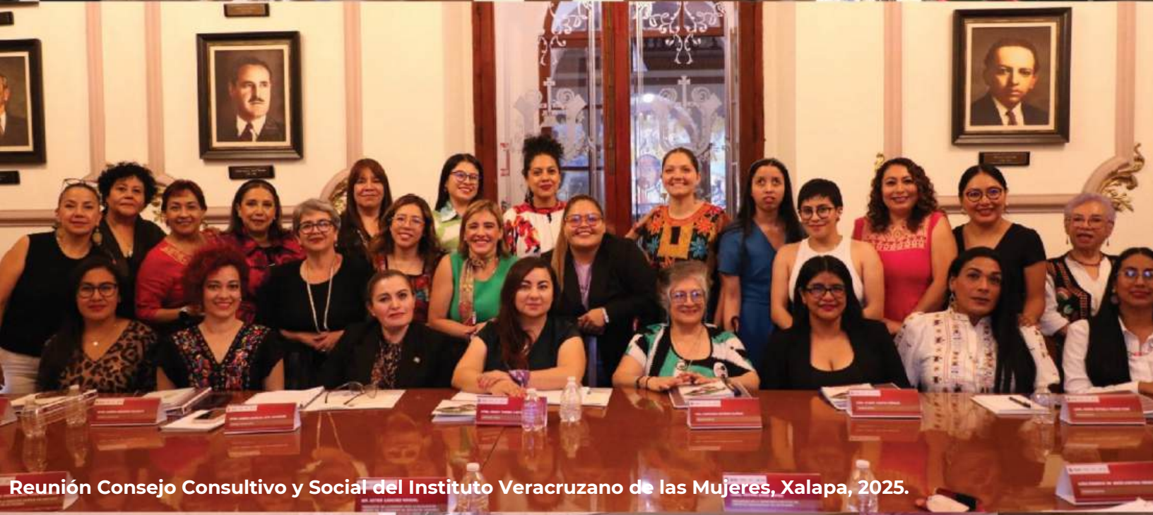
Reunión Consejo Consultivo y Social del Instituto Veracruzano de las Mujeres, Xalapa, 2025.