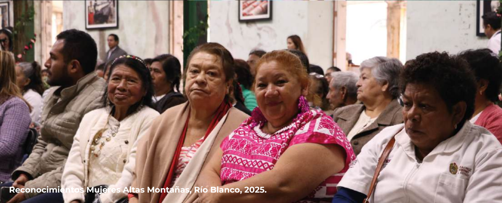
Reconocimientos Mujeres Altas Montañas, Río Blanco, 2025.