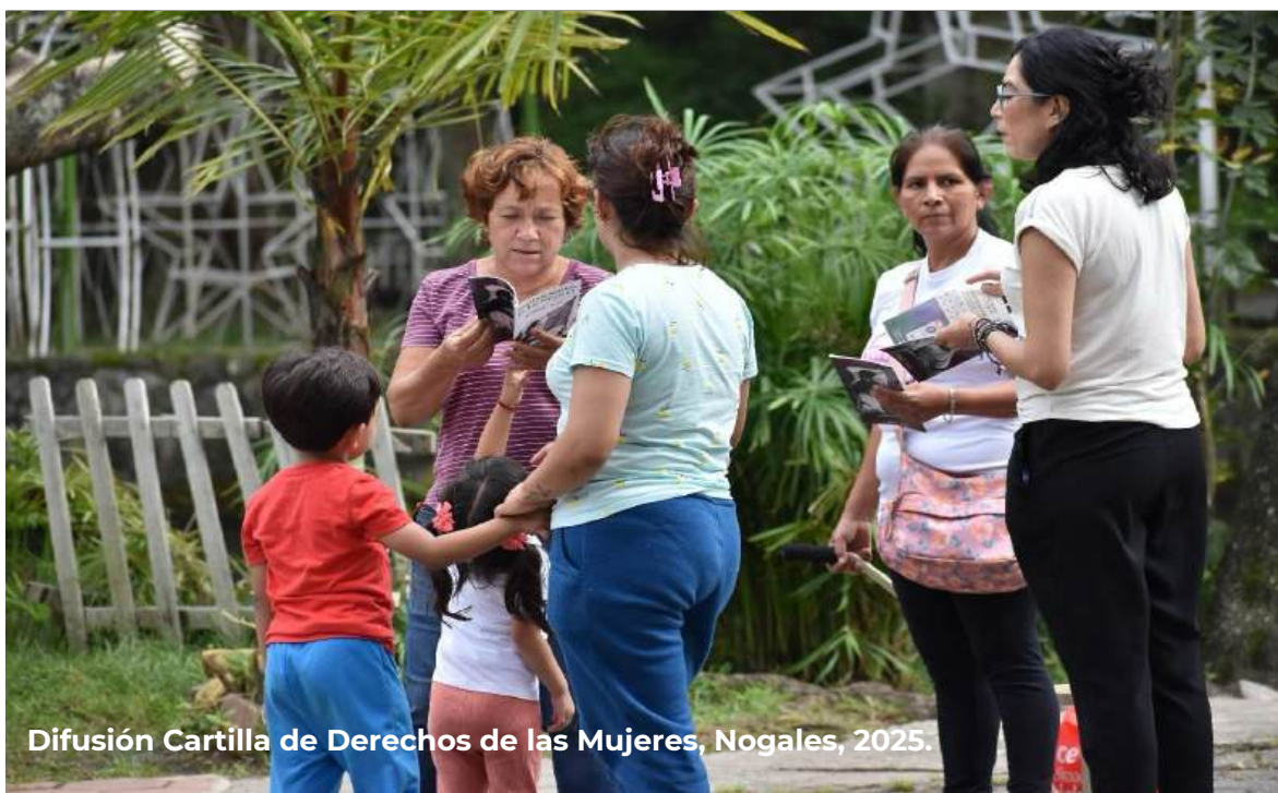
Difusión Cartilla de Derechos de las Mujeres, Nogales, 2025.

Por último, es importante señalar que la construcción, así como la ejecución de los objetivos, estrategias y líneas de acción se desarrollaran bajo con un enfoque de transformación digital, no como un proceso de optimizar las actividades y los servicios que brinda el Instituto, si no con el objetivo de fortalecer las competencias digitales de las y los servidores públicos y de empoderar y acercar las tecnologías de acceso a la información y comunicación a las mujeres, adolescentes y niñas veracruzanas, de manera eficaz, oportuna y transparente.