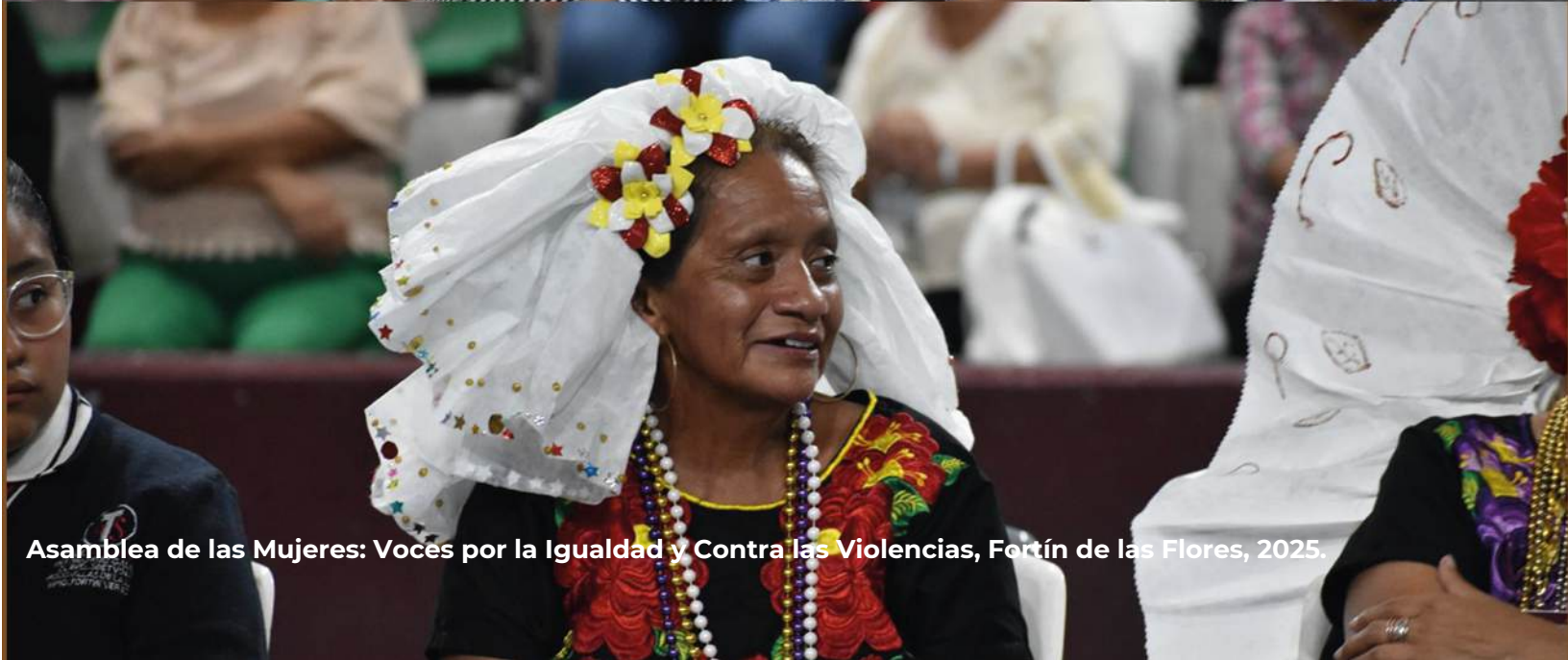
Asamblea de las Mujeres: Voces por la Igualdad y Contra las Violencias, Fortín de las Flores, 2025.